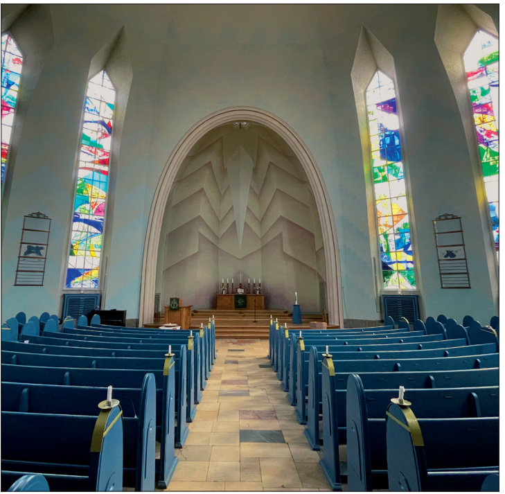
95 Jahre Kreuzkirche